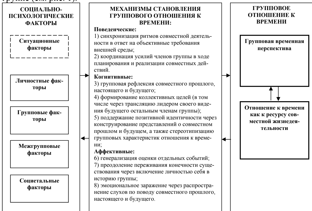
Рис. 1. Концептуальная схема становления группового отношения к времени и его влияния на социальную интеграцию

Выделены несколько групп факторов, влияющих на отношение к времени в группе (см. рис. 1).